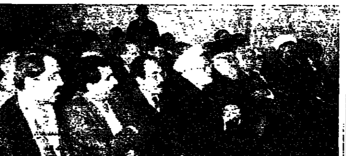
الحضور في الاحتفال